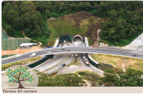
Paraiso del carmen