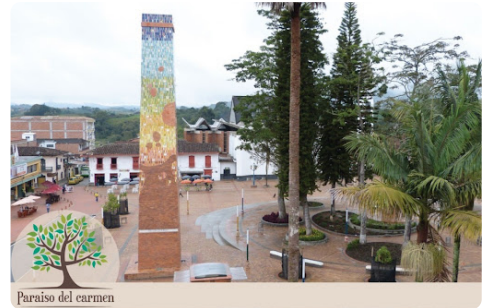
Paraiso del carmen