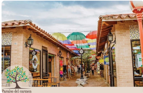
Paraiso del carmen