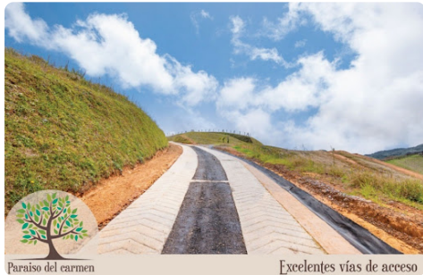
Paraiso del carmen