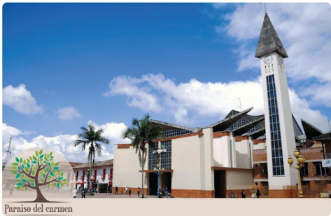
Paraiso del carmen