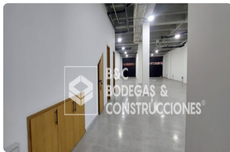
Imagen corporativa, con excelente exposición a la vía principal . Espacio abierto y funcional, ideal para comercio, oficinas, supermercados, droguerías, centros de atención al cliente, entre otros.